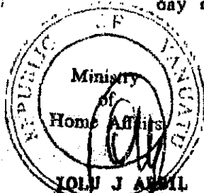
IOLU J ABIL Minister of Home Affairs

MADE at Port Vila, this 10 th day of February, 1989.